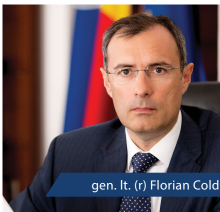
gen. lt. (r) Florian Coldea

În cadrul seriei de prelegeri organizate în ariile disciplinare ale programului masteral de Studii de Securitate Globală , pe care îl desfășoară Facultatea de Științe Politice, Filosofie și Științe ale Comunicării din Universitatea de Vest din Timișoara, în semestrul al doilea al anului universitar 2017-2018 au susținut prelegeri cadre didactice asociate sau invitate la Universitatea de Vest din Timișoara, titulari ai unor discipline specializate în cadrul universităților partenere.